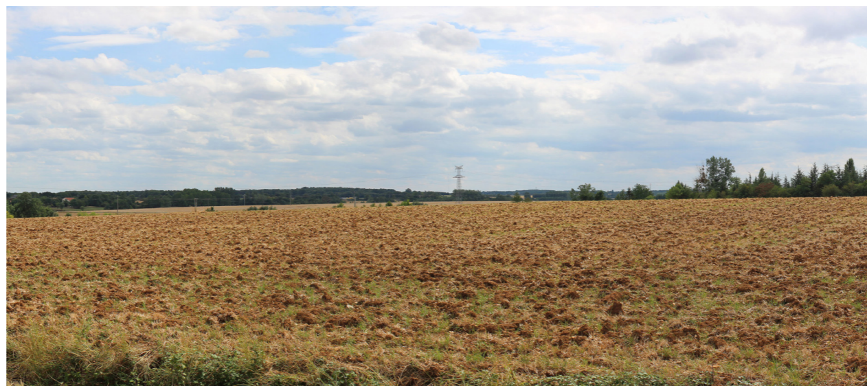
Photographie de l'état initial à 50°